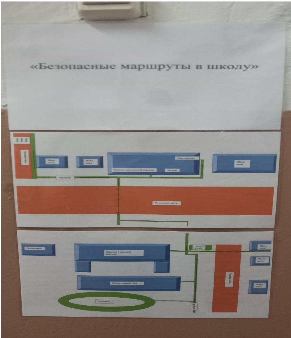
Фото №1 Безопасный маршрут дом –школа-дом