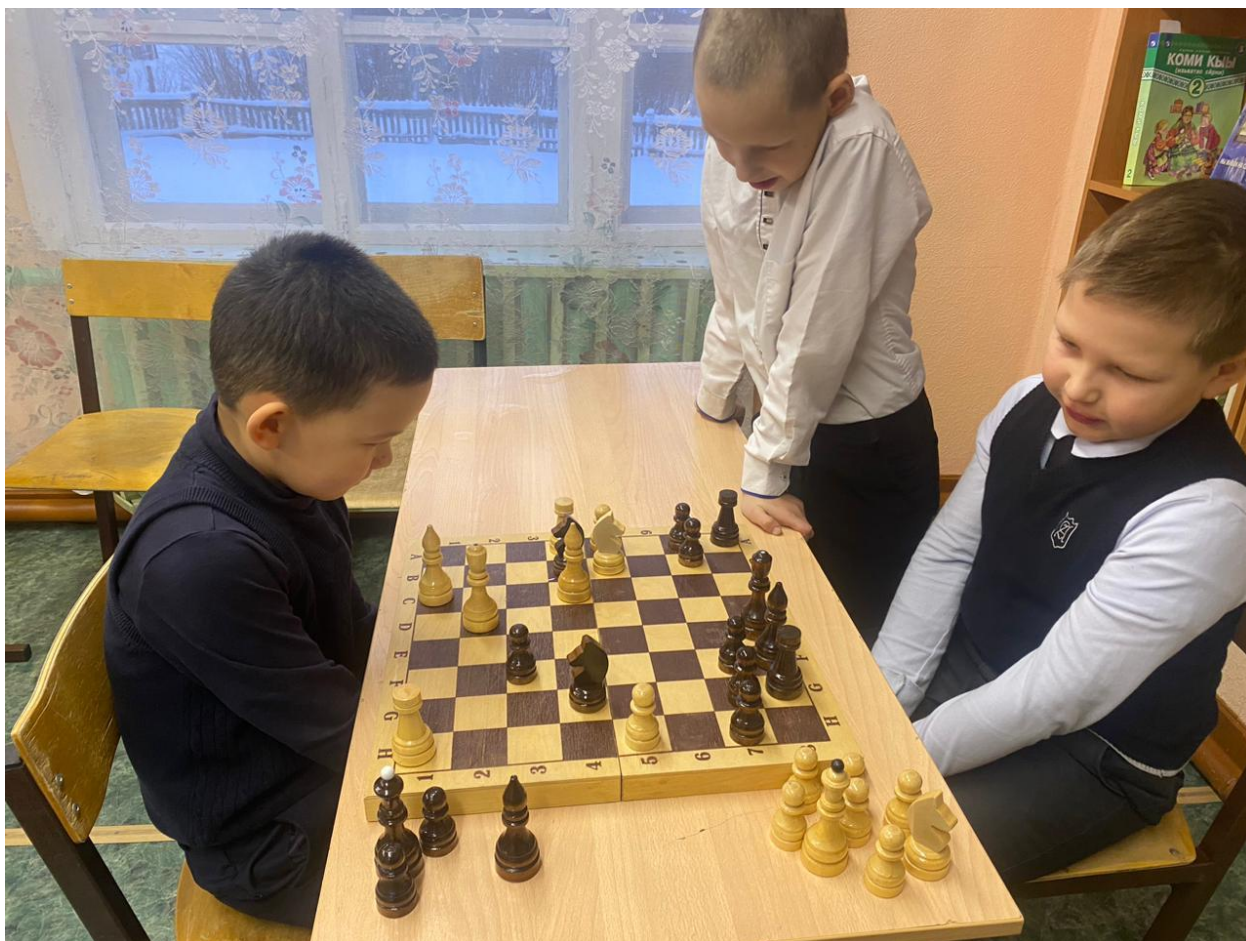
Спортивные секции, сдача норм ГТО